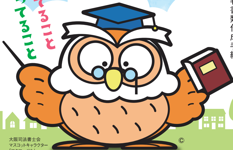
大阪司法書士会 マスコットキャラクター 「フクロロポウ」