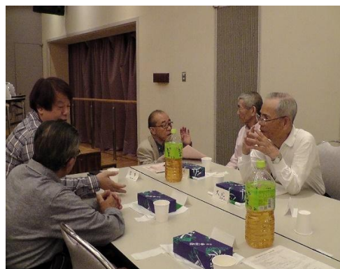
< 総会後の交流会風景 >